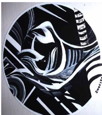
Tolkning, emergent och en liten dos argentinsk tango